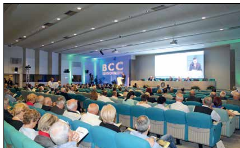
I partecipanti all'assemblea tenuta al Centro Fiera.

• Raccolta: coerentemente con il suo Piano Strategico, la Banca ha attuato una forte ricomposizione degli aggregati: alla riduzione della raccolta diretta (-7%), frutto di una precisa scelta strategica di diversificazione degli investimenti proposti alla clientela, si contrappone un sostanziale aumento della raccolta indiretta (+10,7%) , a conferma della spinta impressa dalla Banca verso prodotti e servizi di risparmio gestito, uno dei pilastri del Piano. Solo la raccolta