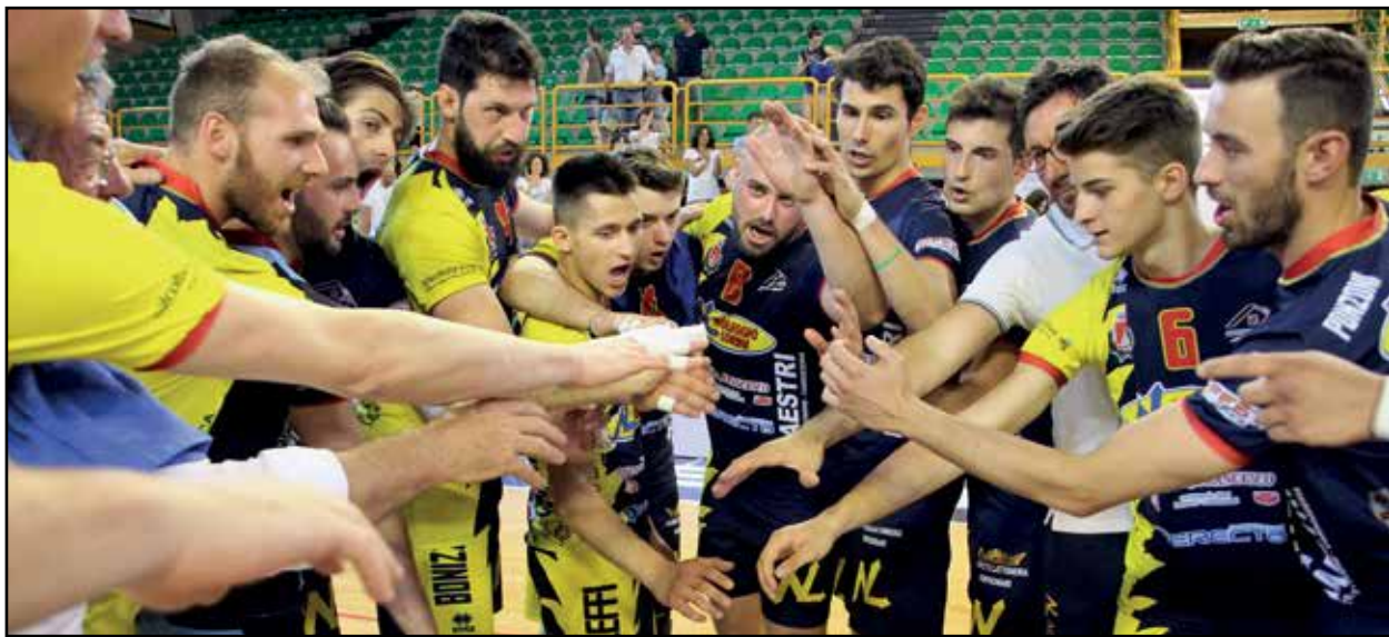
Lo spirito di squadra per una stagione da incorniciare.

Per la pallavolo Noleggio Lorini svanisce il sogno al Palageorge con la sconfitta contro la super favorita Massa.