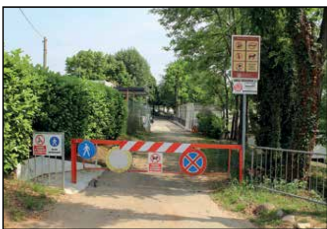
Il divieto di accesso sulla strada vicinale "Longobarda".